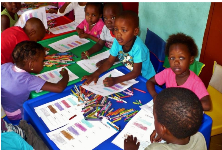
Coloriage et apprentissage des couleurs, tout le monde s'applique