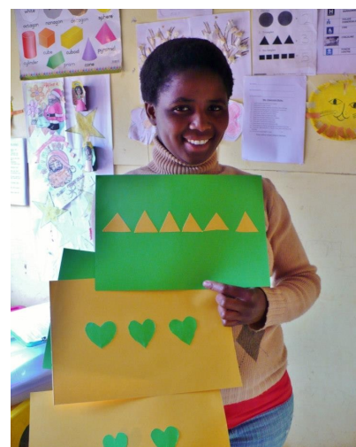
Madame le professeur a confectionné de très beaux outils d'enseignement