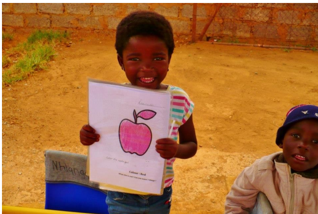
Elle est à croquer ...