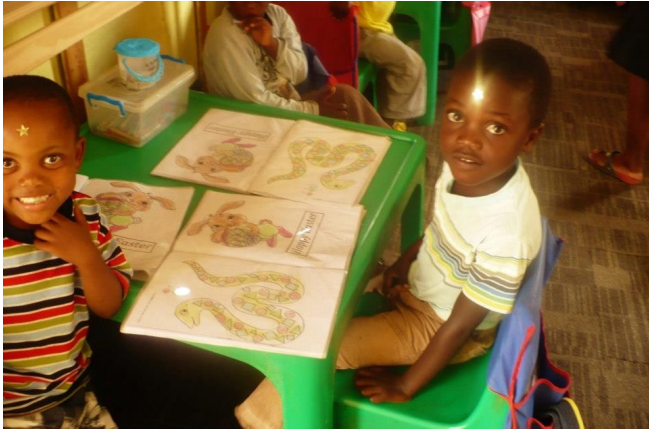
Ils ont tous les deux reçu une étoile dorée en récompense