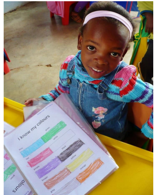
Elle connaît toutes ses couleurs