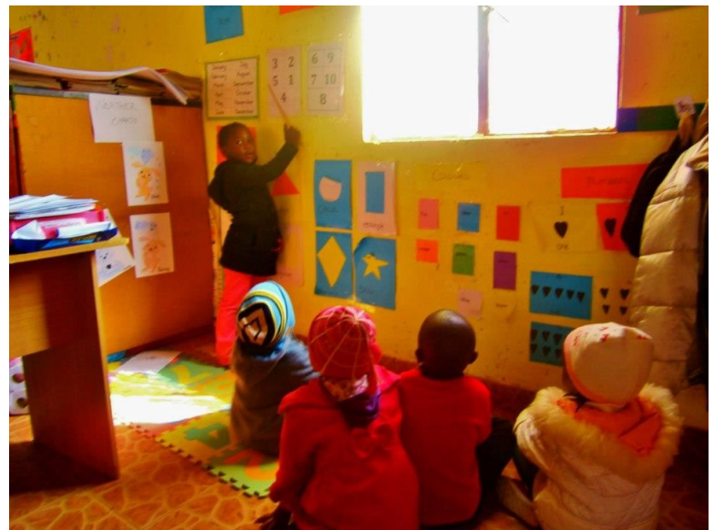
On apprend en jouant au professeur et aux élèves à tour de rôle