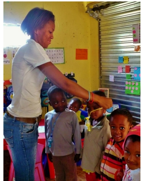
Quatre petits vénards à qui l'on fête l'anniversaire