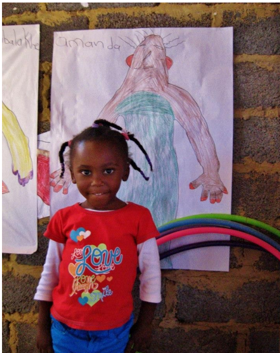
Un auto-portrait très inspiré