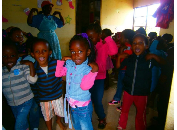
“tête, épaules, genoux et pieds“, on chante des comptines tout en apprenant les parties du corps