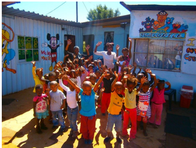
AU REVOIR LES ENFANTS, A BIENTÔT !!!