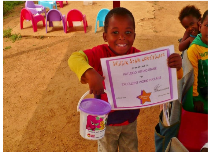
Il a bien mérité son “certificat d'étoile rayonnante”