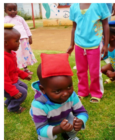
On y arrive avec de la détermination