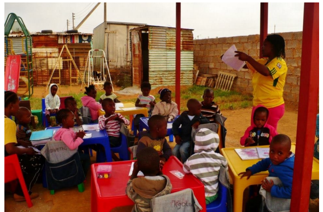
La classe se fait à l'extérieur aujourd'hui