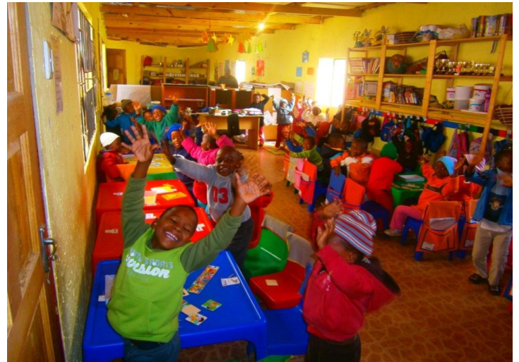
Beaucoup de plaisir ... Dans une immense Joie