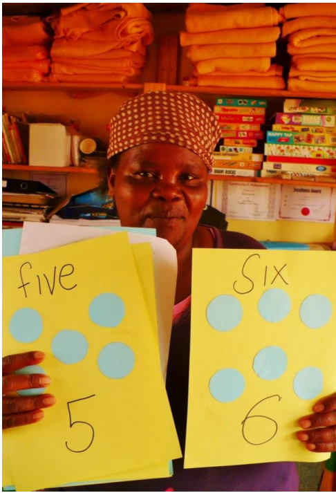
Après les formes et les couleurs, voilà le tour des chiffres