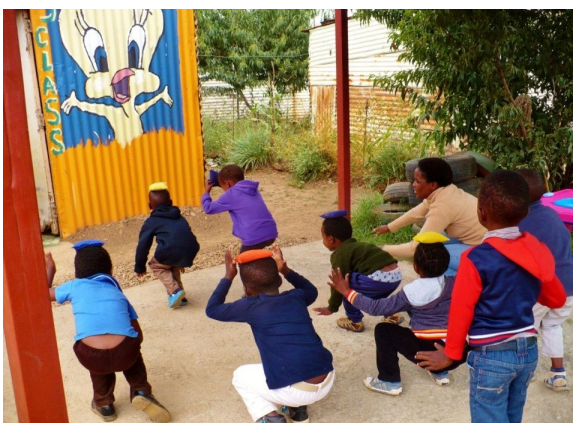
Pas facile de garder l'équilibre un sac de sable sur la tête